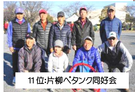
11位:片柳パタック同好会