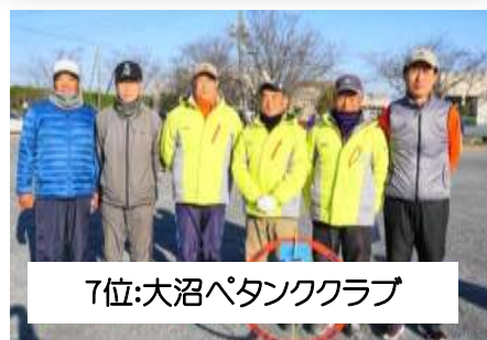
7位:大沼パタッククラブ