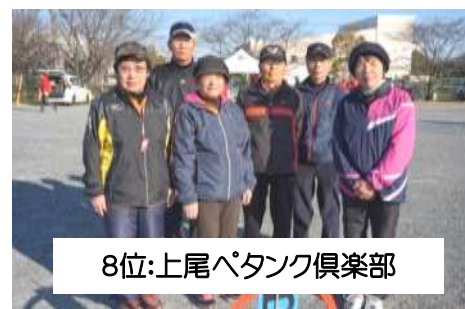
8位:上尾パタック倶楽部