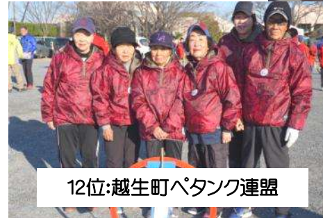
12位:越生町パタック連盟

第11回埼玉県連盟クラブ対抗選手権大会 令和2年2月24日、深谷市川本公民館おまつり広場で第11回埼玉県連盟クラブ対抗選手権大会が開催され、秩父の諏訪パタッククラブが、昨年に続いての2連覇を達成し、令和初代チャンピオンとなった。 予選リーグは2ブロックに分かれAブロック1位の諏訪パタッククラブ、Bブロック1位の和銅黒谷チームが順位決定戦を行い、シングルス戦、ダブルス戦、トリプルス戦勝利した諏訪パタッククラブが総合1位となった。