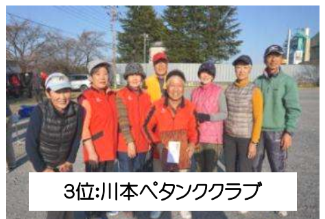
3位:川本パタッククラブ