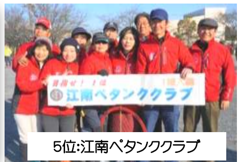
5位:江南パタッククラブ