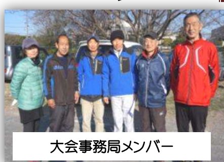
大会事務局メンバー