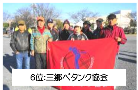
6位:三郷パタック協会