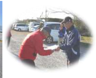
優勝:諏訪パタッククラブ